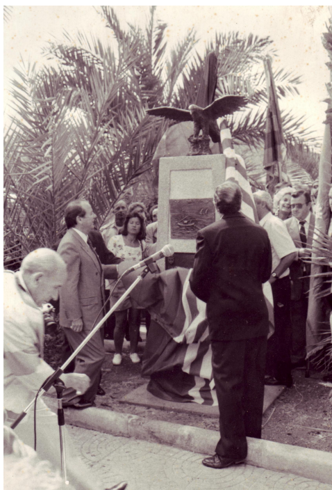
Foto inauguración monumento. XV Trobada Mundial de Peñas Barcelonistas. Águilas, 1991

espectáculo de comunicación, encuentro, cercanía, amistad e indudablemente «una multitudinaria expresión de fervor barcelonista» 8 .